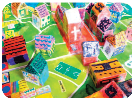
1 er prix cat. 5-8 ans 2011 : Ker-City, Le Conquet (29)

Les enfants gagnants et leurs ludothèques ont reçu une dotation de jeux sous forme de chèques cadeaux.