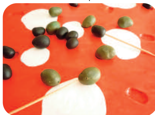
1 er prix cat. 12-15 ans 2011 : Olives party, Pernes-les-Fontaines (84)